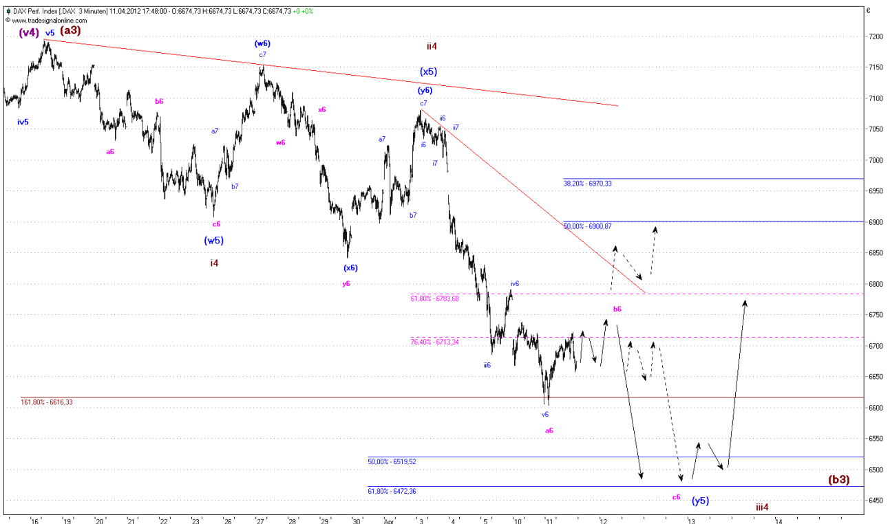
Abb. 2: Dax Minutenchart