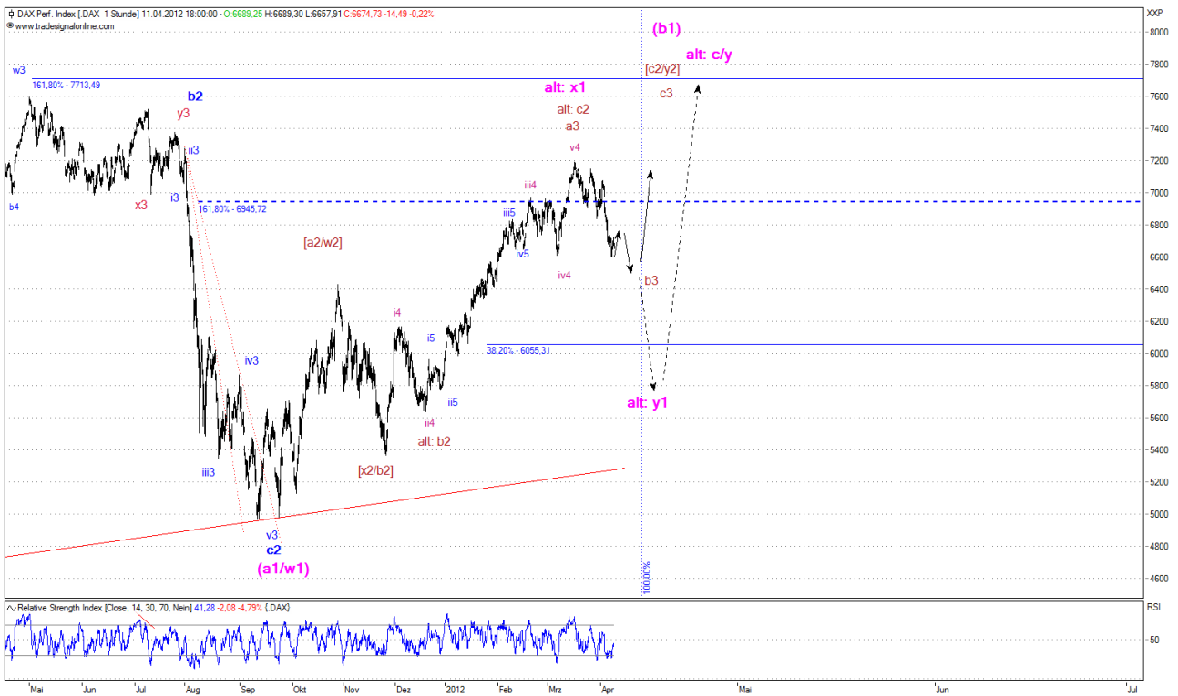
Abb. 1: Dax Stundenchart